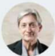
Judith Butler (University of California, Berkeley) Lectio magistralis: Imagining Beyond Fear and Destruction